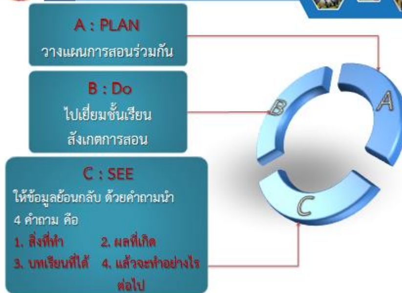
รูปภาพที่ ๒ แผนภูมิแสดงรูปแบบรายละเอียดวงจรการนิเทศแบบคู่สัญญา (Buddy)